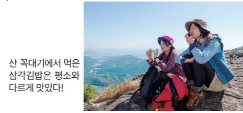
산 꼭대기에서 먹은 삼각김밥은 평소와 다르게 맛있다!