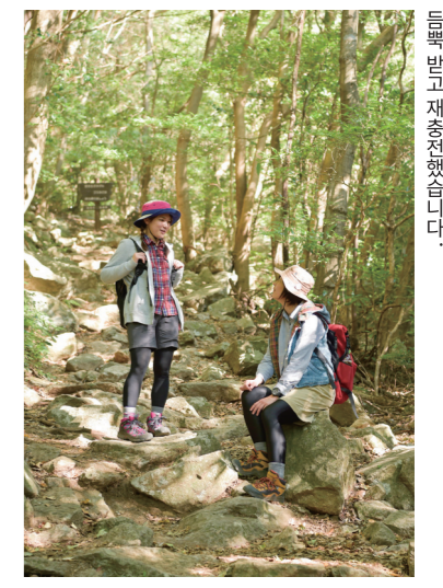
구름 하나 없는 가을의 하루. 나무의 울림과 폭포의 웅장함이 느껴진다.