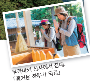
무카바키 신사에서 참배. 「즐거움 하루가 되길」

노 노베오카 시가에서 차로 약 30분으로 갈 수 있는 무카바키야마. 오다케와 메다케 두개의 바위 봉우리로 되어 우뚝 솟은 암벽이 아무도 얼씬도 못하게 하는 분위기를 자아낸다. 언뜻 보면 「저 산을 오를 수 있을까!」라고 생각하지만, 초등학생의 자녀들도 등반 할 수 있을 정도로 오르기 쉬운 산이라고 한다.