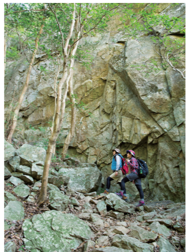
코스 전반에는 엄청나게 큰 바위가 대굴대굴. 자연의 힘을 느낄 수 있다.

분기에서 5분만에 폭포에 도착. 무카바키 폭포는 낙차 76.6m로 「일본 백대 폭포」에 선택된 유명한 폭포이다. 이 날은 수량이 적어서, 수직으로 깎아진 바위를 흐르는 모습을 바로 밑에서 올려다 볼 수 있다. 분기로 가서 산 정상을 목표로 한다. 바위 투성이의 길을 오르고 6부능선에. 여기는 메다케의 깎아지뚝 솟아 있는 바위의 표면이 정면에 우뚝 솟은 절호의 야호 포인트이다. 배의 끝에서부터 「야호!」。 「야호~」가 아닌 짧게 말하는 것이 포인트라고 한다. 오다케와 메다케의 사이를 몇번이고 몇번이고 자기의 목소리가 메아리친다.