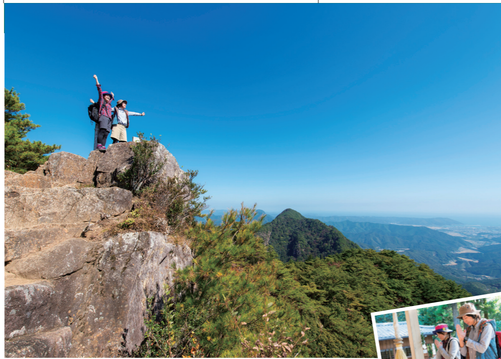
무카바키야마·오다케 산 정상에서. 날씨도 좋고 「기분 최고!」

자연을 소중하게! ● 무카바키야마 코스는 국유림인 동시에 보안림, 자연공원이기도 하다. 동식물등의 보호를 위해, 식물 및 광물을 캐거나 손상 시키지 않도록 합니다. ● 걸으면서 「휴연」은 하지 않습니다. 불의 취급에는 충분히 주의합니다. ● 안내판 및 표지등은 모두들의 소중한 도표입니다. 소중하게 합니다. ● 빈 강릉, 폐지 등의 쓰레기는 버리지 말고 가지고 갑시다. ● 보도 이외에는 들어가지 않도록 합니다.