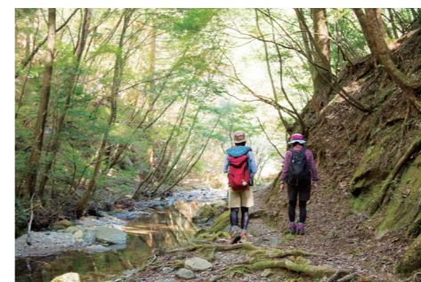
무카바키야마와 상류 연안을 현민의 숲으로 걸어간다. 무카바키야마는 실제로 표정이 풍부하다.